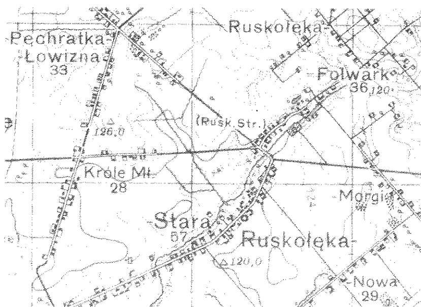
Okolice Ruskołęki według mapy z 1935 roku (skala 1:100 000)

W 1921 roku było 24 domy i 22 inne budynki mieszkalne oraz 329 mieszkańców. Wśród nich naliczono 310 katolików, 16 ewangelików i 3 prawosławnych 6 .